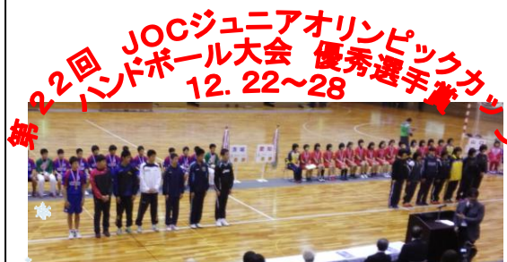
第22回 JOCジュニアオリンピックカップ ハンドボール大会 優秀選手賞 12.22～28